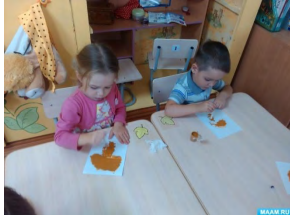
Занятие: «Дождик» (ватные палочки)